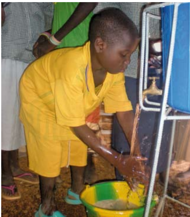
Le lavage des mains

De nettes améliorations ont été constatées en matière d'hygiène. Deux fûts équipés d'un robinet trônent maintenant sous l'auvent où mangent les enfants. Ainsi tous les enfants se lavent les mains avant de se mettre à table sous l'œil attentif d'un auxiliaire volontaire mis à disposition par l'Etat. Ce geste, pour nous naturel, est d'autant plus important que beaucoup d'enfants mangent avec les mains. Chaque enfant a maintenant un gobelet, alors qu'auparavant il n'y avait qu'un seul gobelet pour tous.